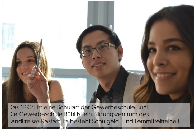
Das 1BK2T ist eine Schularart der Gewerbeschule Bühl. Die Gewerbeschule Bühl ist ein Bildungszentrum des Landkreises Rastatt. Es besteht Schulgeld- und Lernmittelfreiheit.

Sofern freie Plätze vorhanden und Anforderungen genügen, ist auch eine Aufnahme bis zu einem Notendurchschnitt von 3,25 möglich.